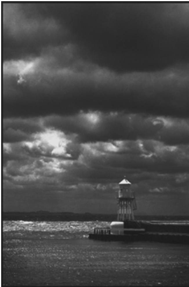
Fyr, Rå å havn