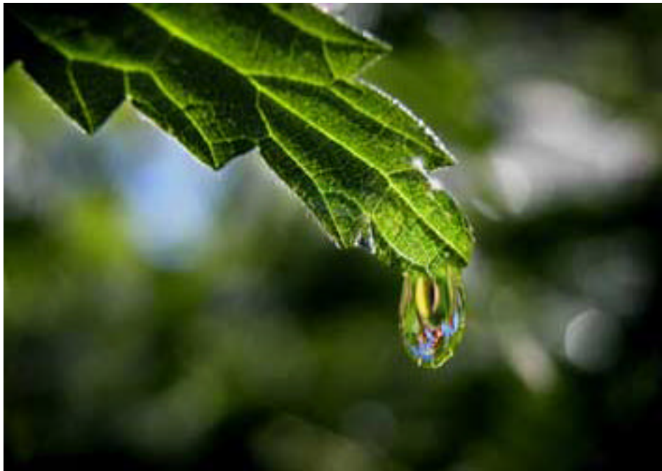
Blad med dråber