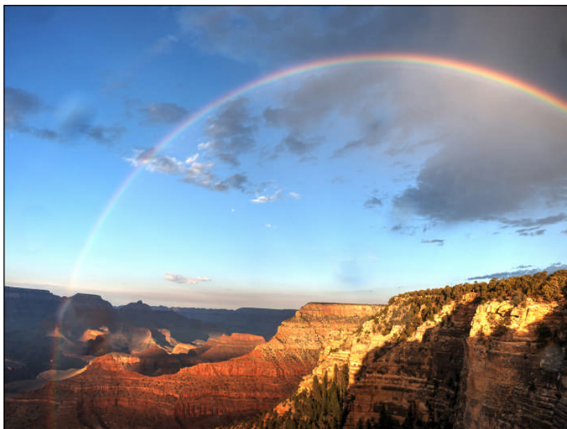
Gran Canyon juni 2014

Vi genoptager en anden tradition med at se ferie billeder i starten af sæsonen. Tag gerne en 5 – 10 (og aller-aller højest 20) billeder med fra en eller anden ferie (fx på en USB), og fortæl lidt om ferien og billederne. Det behøver ikke lige at være sommerferien i år – vi er ikke alle samme så hurtige til at få lavet billeder!