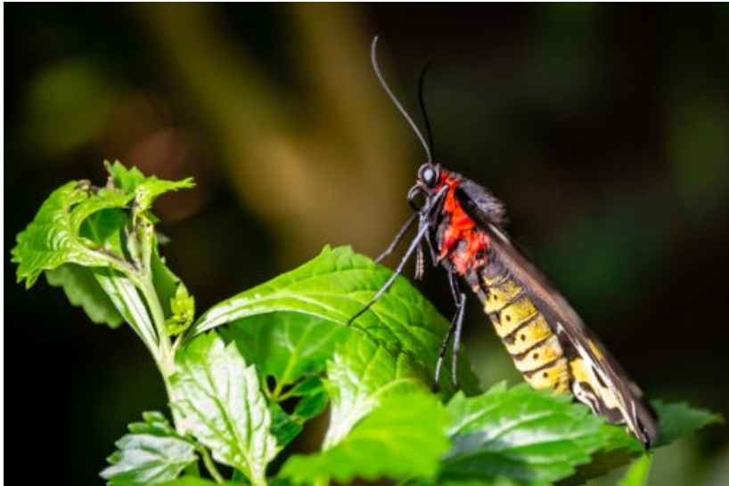
2. plads, glas 2, digital, "Sommerfugl" af Lisbeth Frank