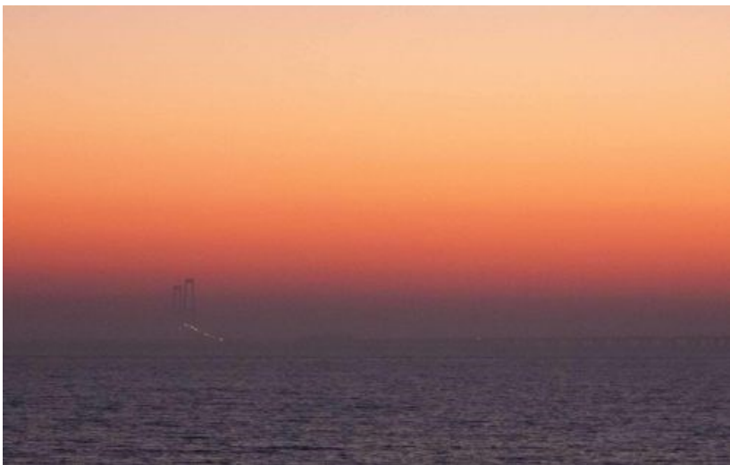
2. plads, glas 2, papir, "Store Bæltsbroen" af Uwe Hess