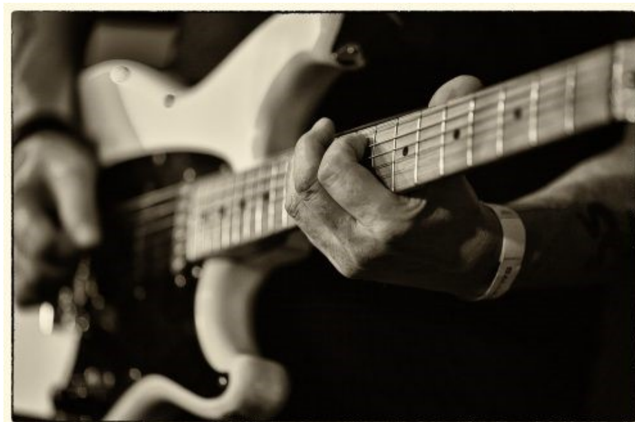
2. plads, papir glas 1 "Guitar spil" Søren D Andersen