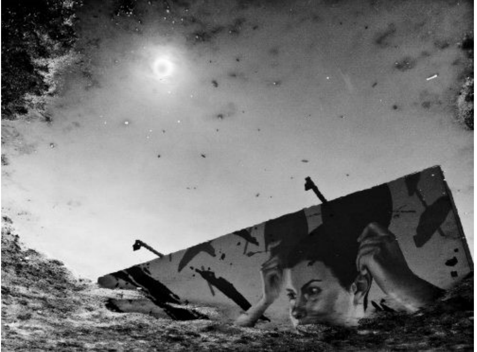
1. plads, digital glas 1 "De Underjordiske" Henning Gustafsson