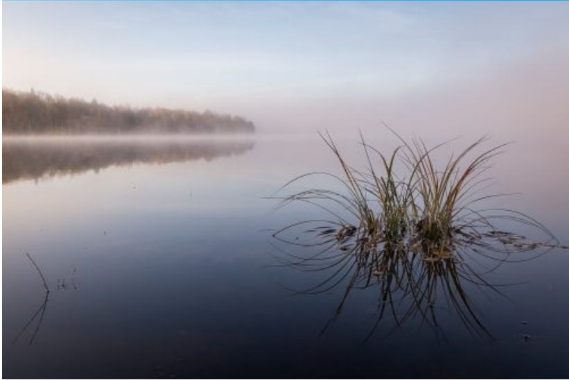
Årets billede papir "Morgendis" af Alf Aagaard