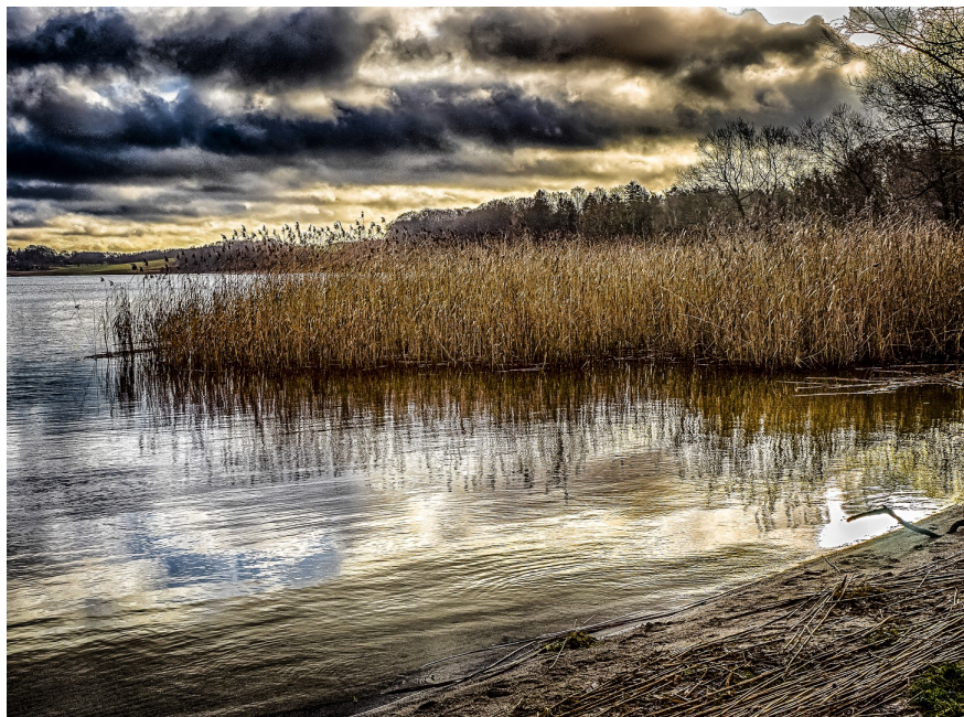
Tystrup Bavelse Sø