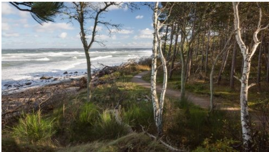
2. plads, digital glas 1 "Hornbæk Strand" Niels M. Nielsen