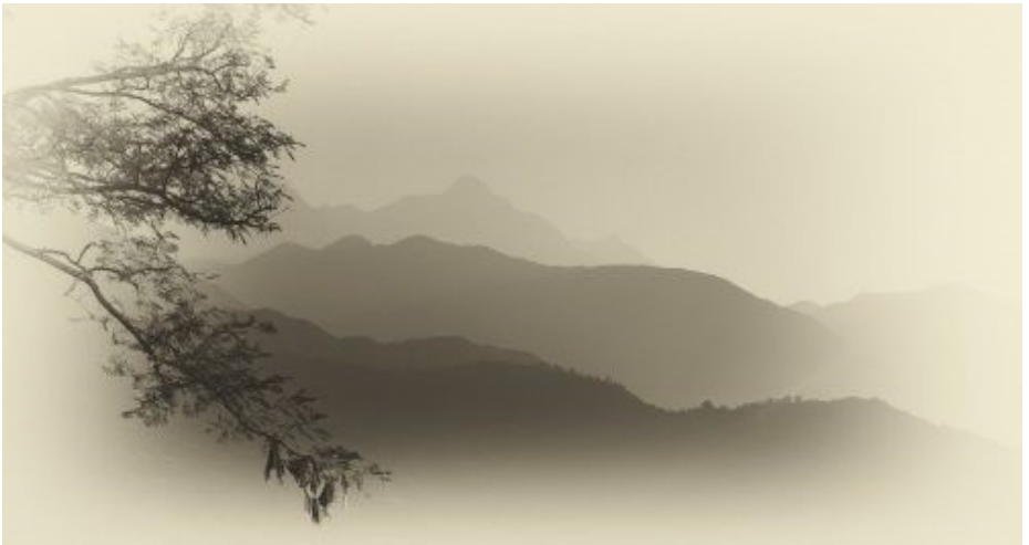
1. plads, papir glas 1 "Himalaya" Alf Aagaard