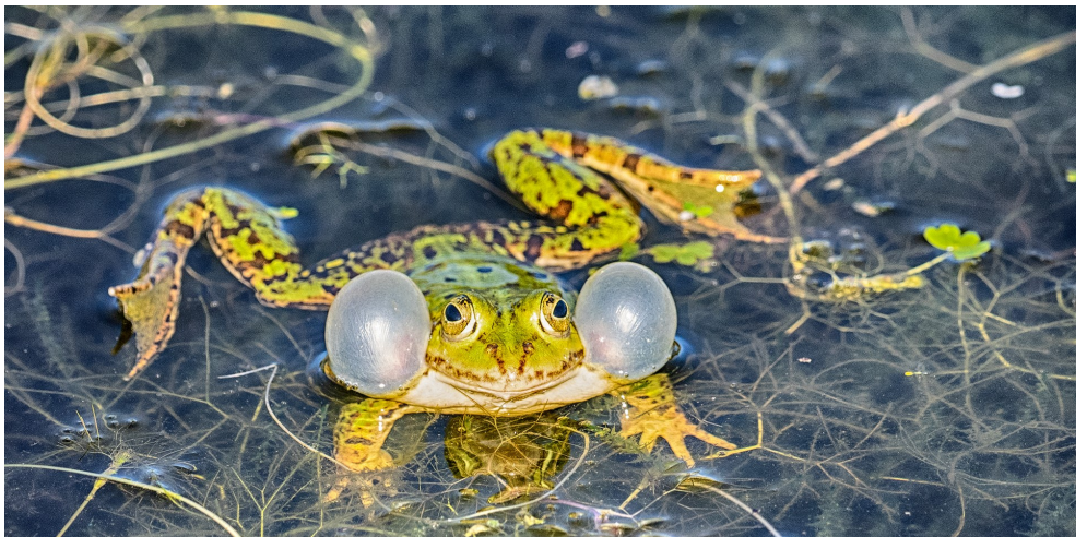
Christiansø frø med to balloner