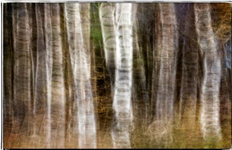
Nr. 2 i Årets billede digital "Roterende birk" af Søren D. Andersen