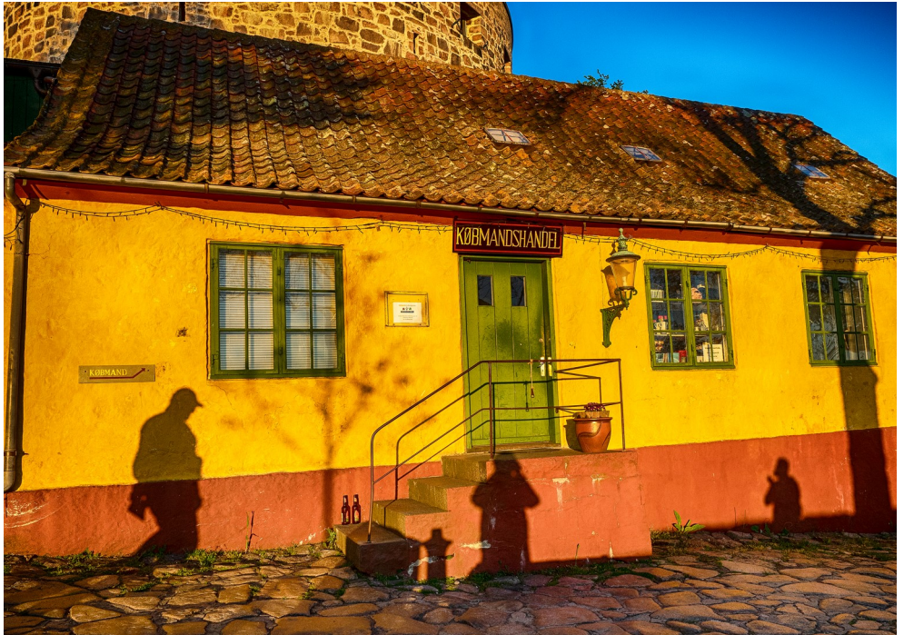
Købmanden på Christiansø