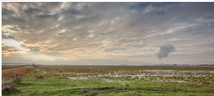
Deltager i Land- skabsbille- der

Det er selvfølgelig nogle flere penge, der skal op af lommen, men til gengæld foreslår bestyrelsen til vores egen generalforsamling, at vi nedsætter kontingentet. Derved bliver det alt i alt noget billigere end i dag, hvis man ikke skal have Dansk Fotografi som trykt blad, og meget billigere, hvis man vil nøjes med at være 'basis' medlem. Men det kan ikke skjules, at den samlede pris stiger, hvis man gerne vil have det trykte tidsskrift, ligesom det er i dag - og frem til 1. juli.