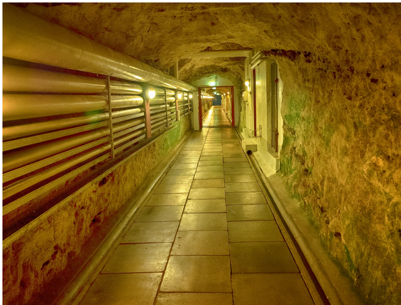
De underjordiske gange på Stevns Fortet

Vi skiltes efter en dejlig dag og satte snuden hjem.