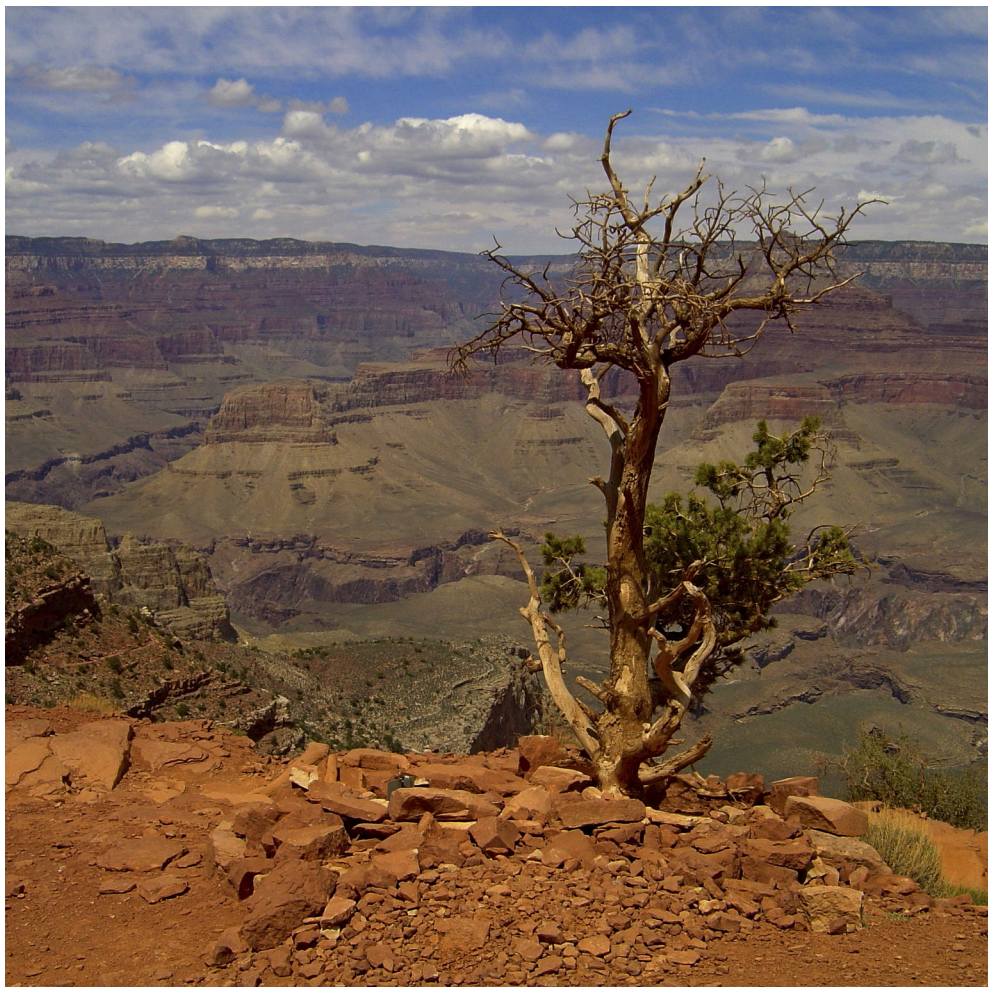
”Grand Canyon” af Flemming Sørensen