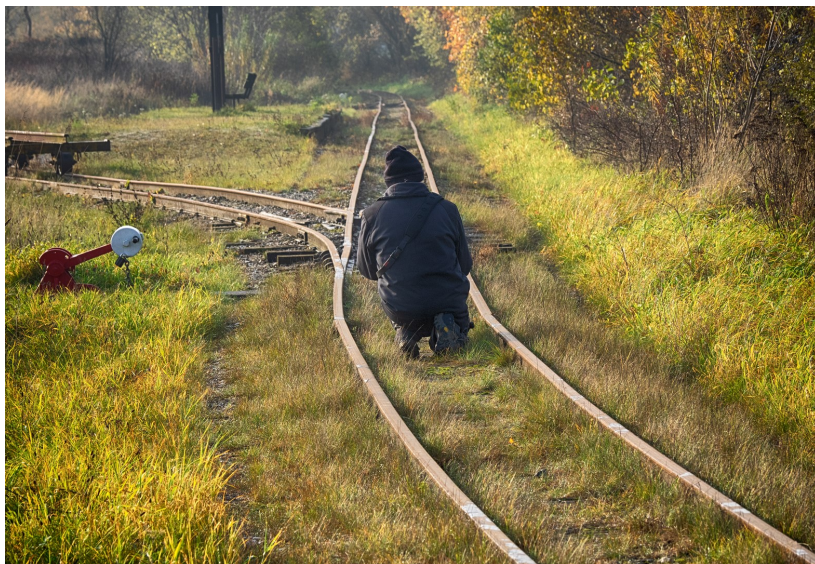
Jes på sporet

En dejlig dag med en masse billeder, samt en god snak, hvor vi fik klaret verdens problemer.