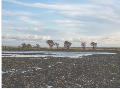
Billede 2, Mudderpøl