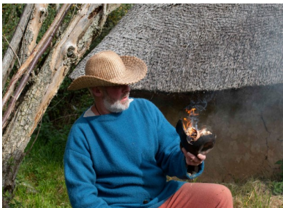
Offermosen og ildmager.