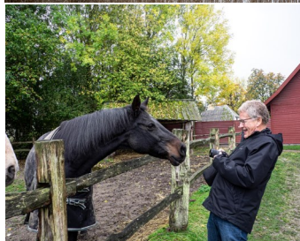
På med pilen.