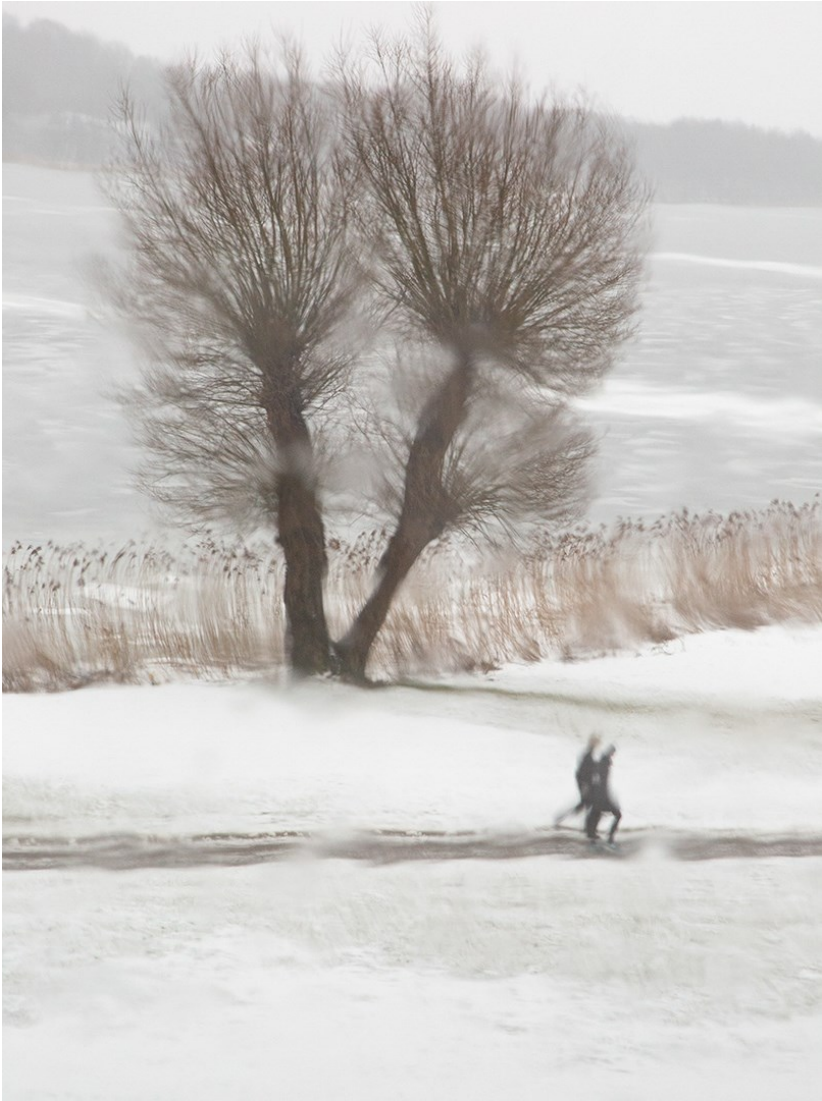
Papir, 1. plads, Vinterløb” af Søren D. Andersen