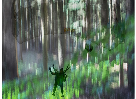
Digital nr. 3 "Sindstilstand" af Kalle