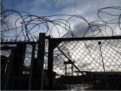
Billede 1, Indgang til Fortet