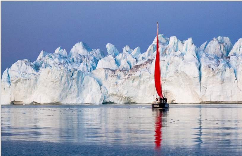
NFFF sølvmedalje ved 4. Nordiske International Cir- cuit, Finland, "Red sail" af Tage Christiansen