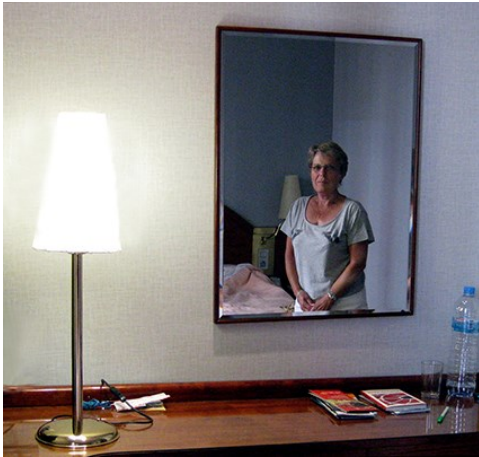
Digital nr. 2 "Kvinden i spejlet" af Preben H. Presmann