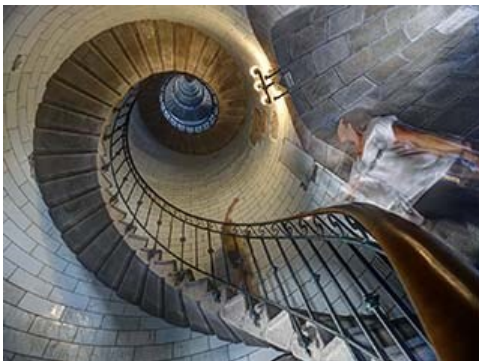
Papir nr. 2 "Trappe" af Uwe Hess