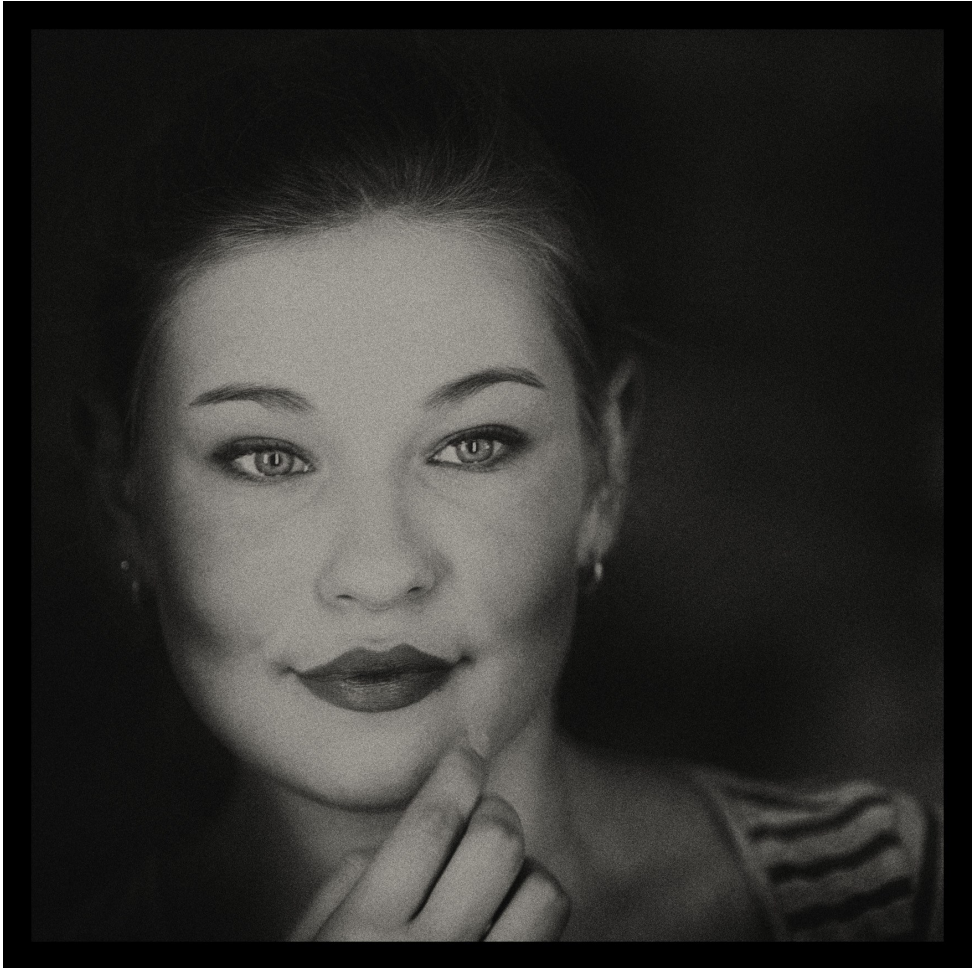
Digital, 1. plads, "Klar" af Søren D Andersen