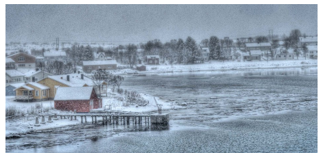
Papir nr. 3 "snefog" af Lise Aagaard