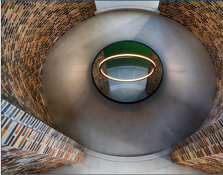
1. plads, Region Nord papir 1, "Cirkler" af Tage Christiansen