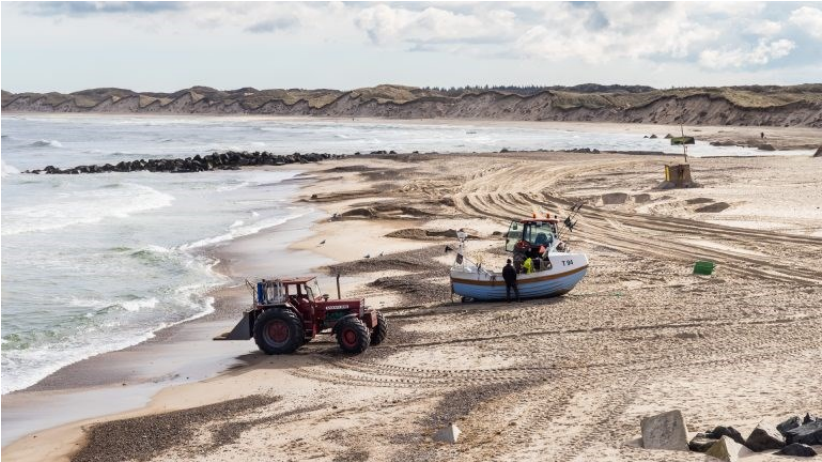
1. plads, "Fiskeren", af Niels Nielsen