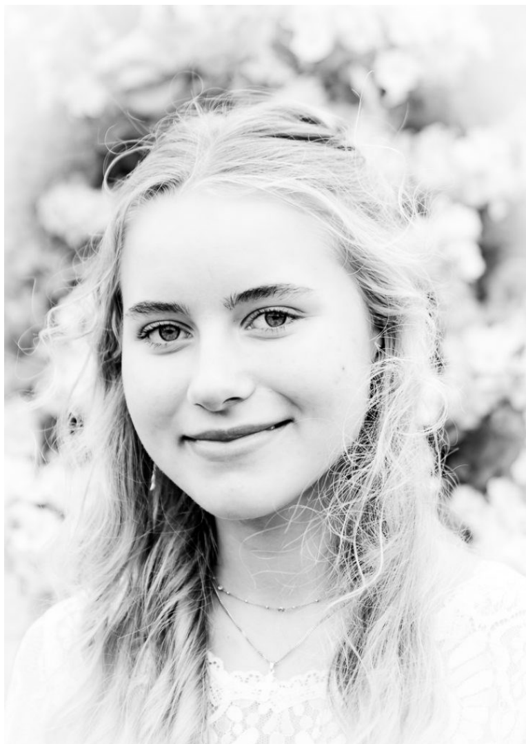
1. plads, Glas 2, papir "Esther" af Børge Klit Johansen