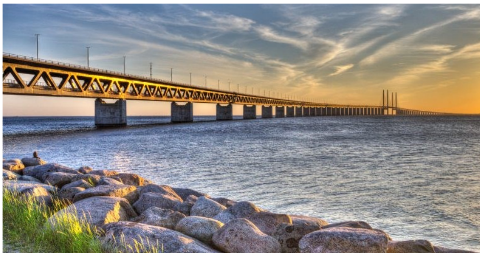
3. plads, Glas 2, papir, "Øresundsbroen" af Susanne Sørensen