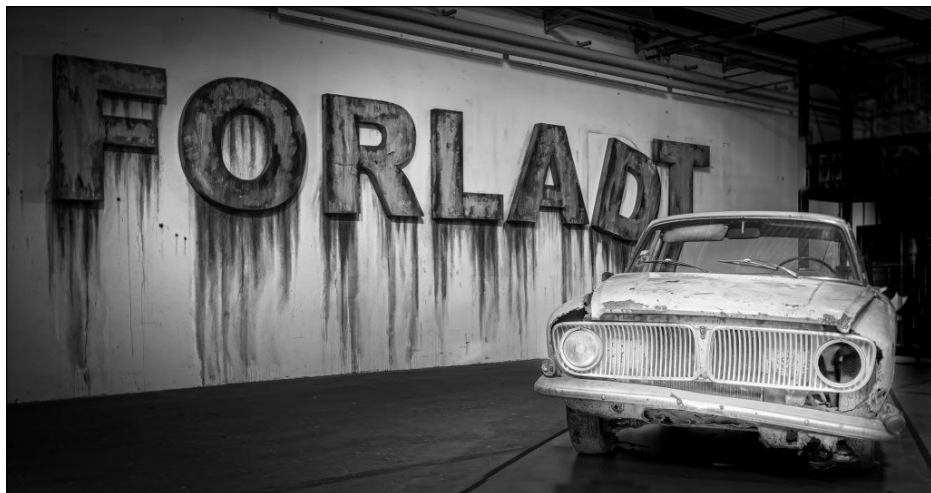
2. plads, Glas 2, papir, "Forladt" af Tage Christiansen