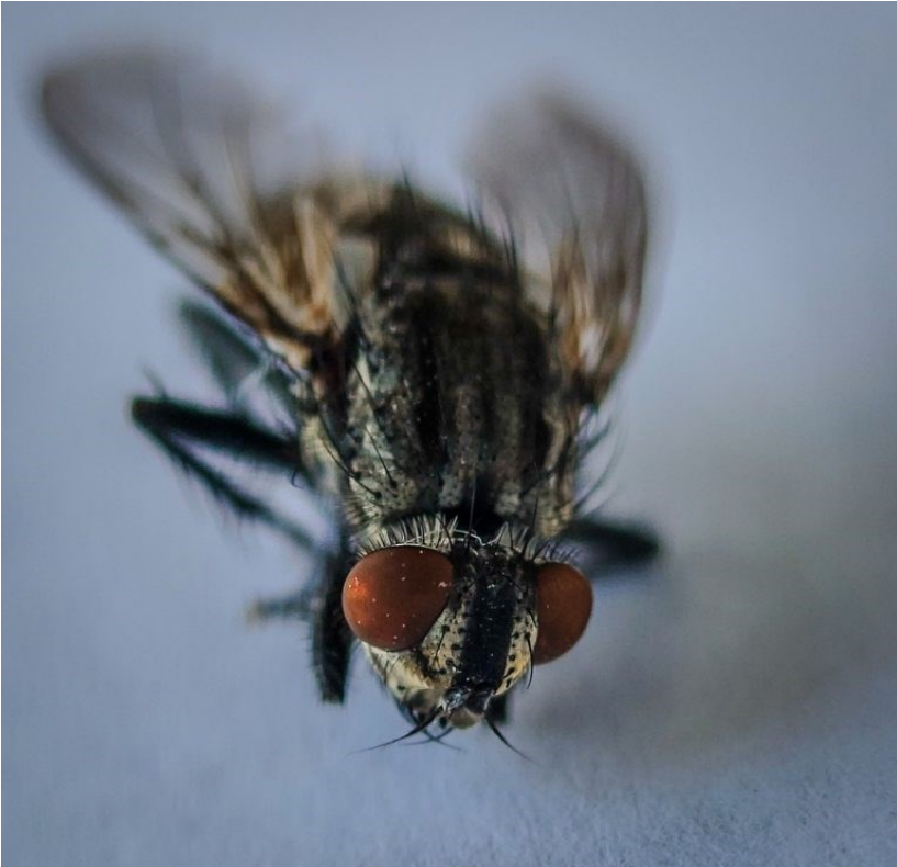
3. plads, "Fluen" af Børge Klit Johansen