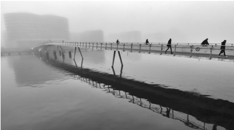
6. plads, "På vej væk fra tågen" af Allan Quist Jensen