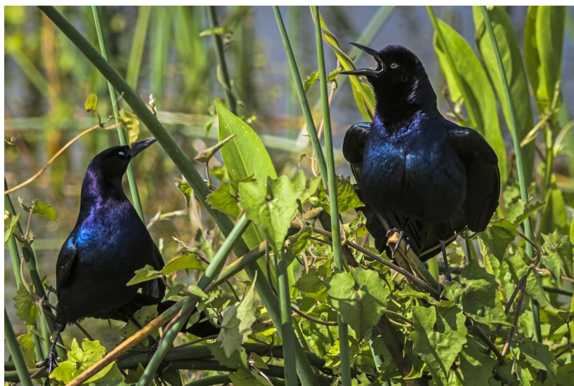
Jesper har gennem tiderne taget mange fuglebilleder, bl.a. denne "Boat-tailed Grackle", fra Florida, USA