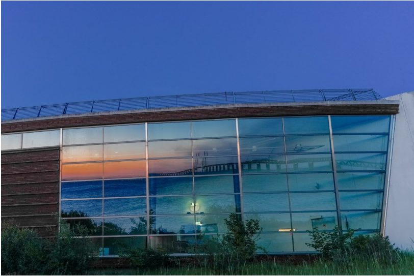
4. plads, "Aftenspejling ved Øresund" af Niclas Jensen