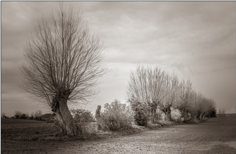
2. plads, "Stynede træer" af Tage Christiansen