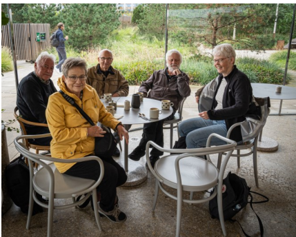
Billeder fra turen