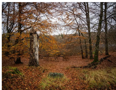
Billeder fra turen